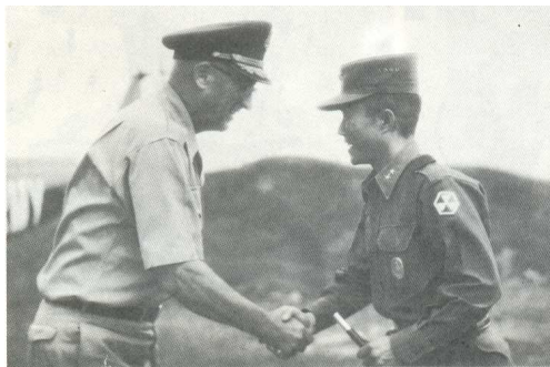
General Choi Hong Hi sendo cumprimentado pelo famoso General Guy Stanley Meloy Jr. então comandante do 8º Exército dos EUA.